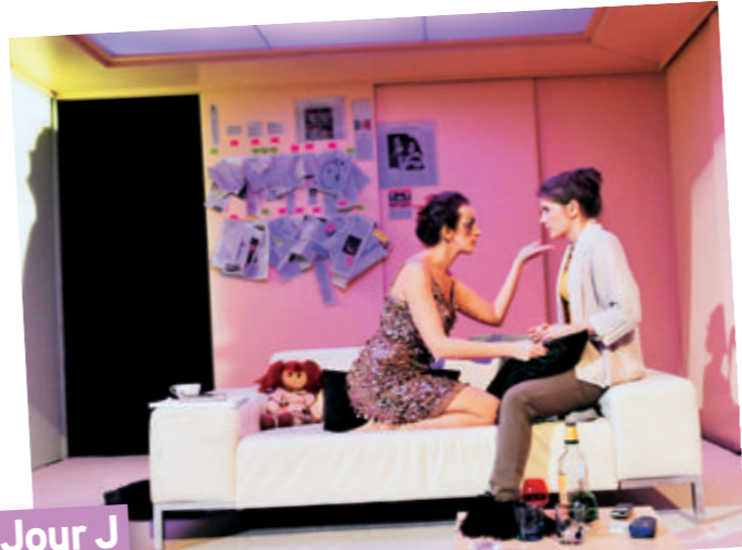
Répétitions dans le décor, derniers ajustements.