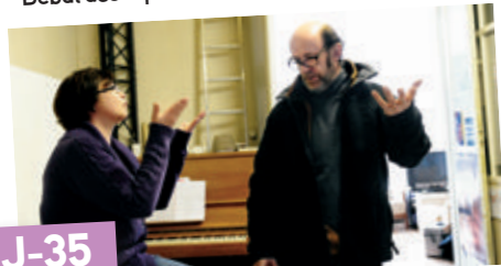
Début des répétitions de la pièce.